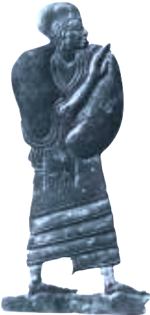
לוחית ברונזה המתארת אציל כנעני. תקופת הברונזה המאוחרת

החוקר האירי לזלי פורטר זיהה לראשונה את חצור המקראית עם תל אֶל-קֶדֶח (1875). בשנת 1928 ערך הארכיאולוג הבריטי ג'והן גרסטאנג חפירה קצרה במקום. משלחת מטעם האוניברסיטה העברית, בראשות יגאל ידין ובמימון קרן רוטשילד, ביצעה בתל את החפירה הנרחבת הראשונה (1955-1958, 1968-1969). החפירות התחדשו בשנת 1990 בידי משלחת בהנהלת אמנון בן-תור. "חפירות קרן זלץ בחצור לזכר יגאל ידין" נערכות מטעם האוניברסיטה העברית, בחסותה של החברה לחקירת ארץ ישראל ועתיקותיה. למימון החפירות מסייעים קרן זלץ (ניו-יורק), קרן אנטיקווה (ז'נבה), קרן ברמן (האוניברסיטה העברית), קרן הכס וגורמים פרטיים.