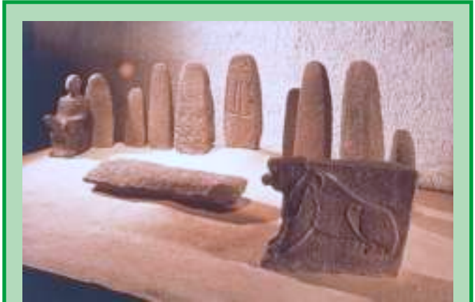
אל או מלך, מצבות פולחן ואריה ממקדש בעיר התחתונה

המגדל הנראה בקצה המערבי של התל הוא שריד הבנייה הישראלית המאוחר ביותר שנבנה בחצור. המגדל נבנה כחלק ממערך ההגנה שנועד לקדם את פני הצבא האשורי, אך בסופו של דבר הצליחו האשורים לכבוש את חצור. "בִּימֵי פֶּקַח מֶלֶךְ-יִשְׂרָאֵל, בָּא תְּגִלַּת פְּלֶאָסָר מֶלֶךְ אֲשׁוּר, וַיִּצָּח אֶת-עֵינָו וְאֶת-אֶבֶל בֵּית-מַעֲכָה וְאֶת-יְנוּחַ וְאֶת-קָדֵשׁ וְאֶת-חָצוֹר וְאֶת-הַגִּלְעָד וְאֶת-הַגְּלִילָה, כָּל אֶרֶץ נַפְתָּלִי; וַיָּגֶלֶם, אֲשֶׁרָּהָ" (מלכים ב' ט"ו 29).