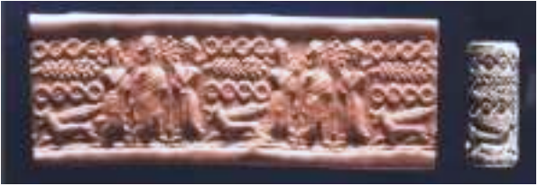
חותם שנמצא בארמון הכנעני, המתאר סצנה פולחנית

לא רק תעודות מעידות על גדולתה של חצור הכנענית, אלא גם, ואולי בעיקר, הממצאים שהתגלו בחפירות. העיר הענקית הייתה מבוצרת בסוללות עפר ובחומות. נמצאו בה ארמונות, מקדשים, בתי מגורים, כלי חרס, פסלים, כלי נשק, תכשיטים וחפצי אמנות רבים. הממצאים מעידים על הקשרים הנרחבים של חצור עם סוריה, מצרים, ממלכת החיתים, בבל ועם ארצות הים התיכון – כרתים, יוון וקפריסין. קשרים אלה הקנו לחצור את התואר "ראש כל הממלכות האלה" (יהושע י"א 10) ומלך חצור זכה בתואר "מלך כנען" (שופטים ד' 2).