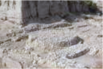
תל מגידו – במת פולחן כנענית