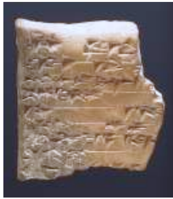
מכתב לאבני (אדון) מלך חצור(?) מאה 18 לפסה"נ

כתובות בכתב יתדות המוטבעות על לוחות טין, פסלים מאבן ומברונזה ותכשיטים. הארמון חרב בשרפה אדירה במאה ה-13 לפסה"נ.