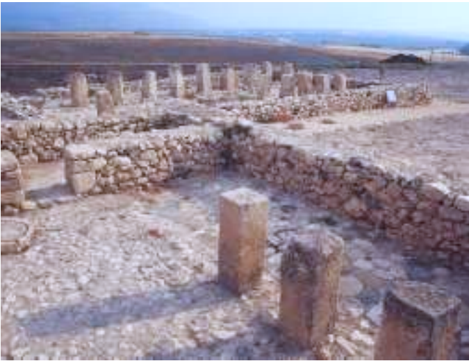
בית פרטי ומבנה ציבורי מהתקופה הישראלית

"...כי-חצור לפנים היא, ראש קל-הממלכות האלה" (יהושע י"א 10)