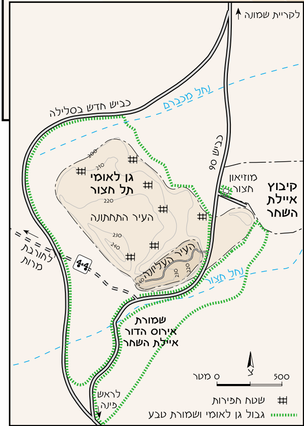
תל חצור - העיר העליונה והעיר התחתונה