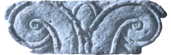
אחת משתי כותרות התימורה שעוטרו את שער הכניסה למצודה הישראלית

בקצה המערבי והגבוה של העיר העליונה נחשפו שרידים של מצודה שנבנתה ככל הנראה בימי אחאב (המאה ה-9 לפסה"נ). השער המונומנטלי שכלל סף, מזוזות, כותרות מסוגגנות (שכמותן נמצאו גם במבני ציבור במגידו, בשומרון ובירושלים) ומשקוף, הועברו למוזיאון ישראל בירושלים. המצודה הנראית כיום באתר – ממנה שרדו היסודות בלבד – נבנתה על שרידי מצודה קדומה יותר ומעל לחומת הסוגרים המיוחסת לימי שלמה. המצודה נהרסה יחד עם העיר כולה בידי תגלת פלאסר ה-3, מלך אשור, בשנת 732 לפסה"נ.