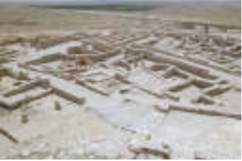
תל באר שבע – מראה כללי