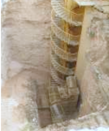
מפעל המים של חצור –