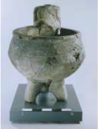
פסל אל כנעני

כתיבה: פרופ' אמנון בן-תור ורוחמה בונפיל;