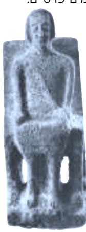
פסל מאבן בולת. תקופת הברונזה המאוחרת