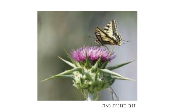
זנב סנונית נאה