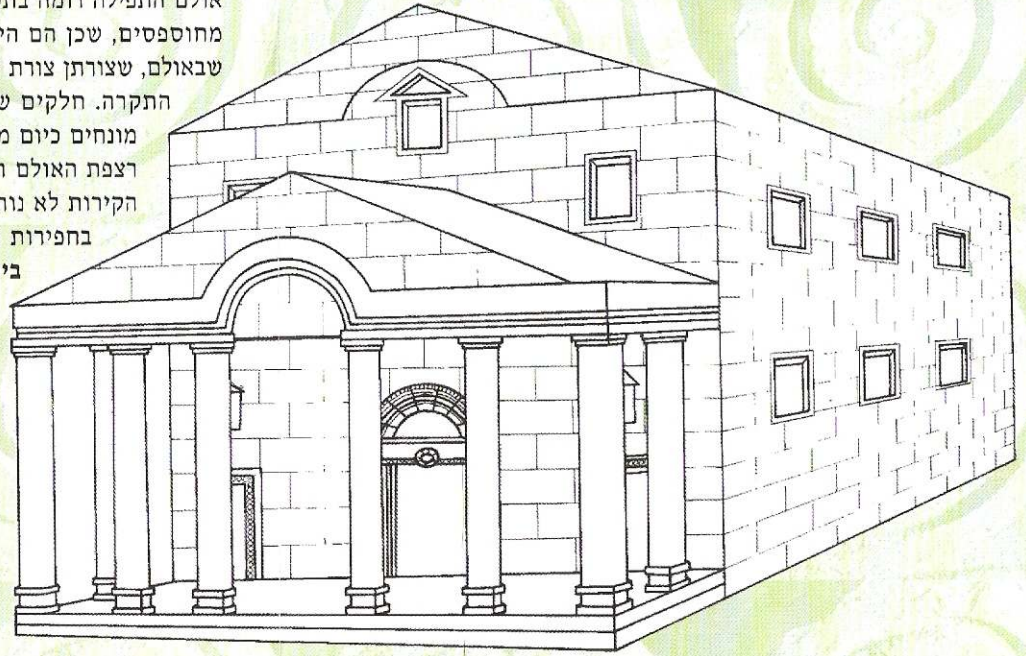
ציור משוחזר של בית הכנסת הגדול

מאז הכרזת האתר כגן לאומי בשנת 1966, הוא נמצא בטיפול של רשות הטבע והגנים.